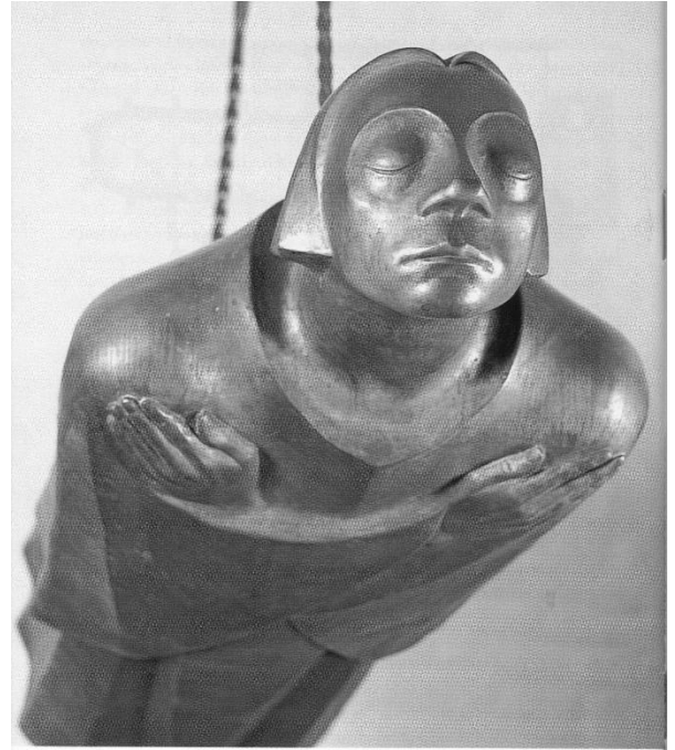
Gedicht hierbij: 'Zonder vleugels'